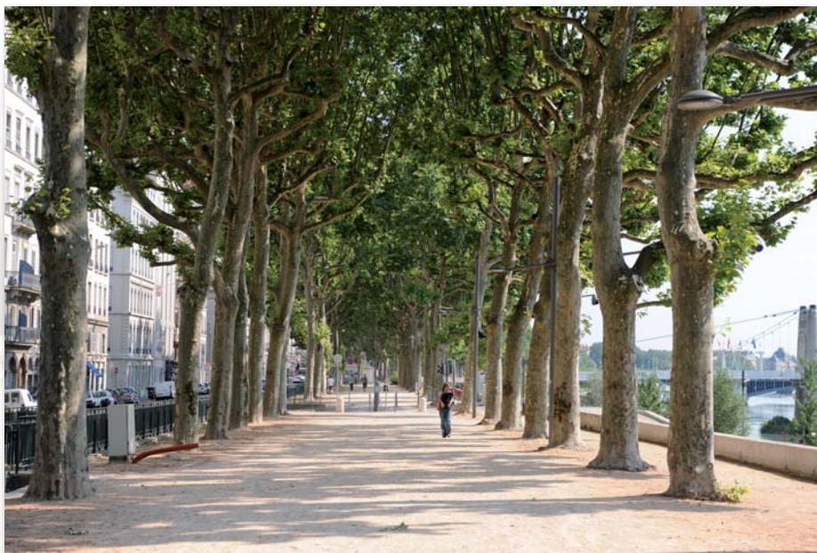
Lyon 6ème - Quai du Général Sarrail

Les arbres et arbustes sont des éléments vivants et sensibles à toutes agressions (pollution, chocs, taille répétée, sol,...). Un entretien et un suivi de ce patrimoine sont donc nécessaires afin de le maintenir en bon état de santé.