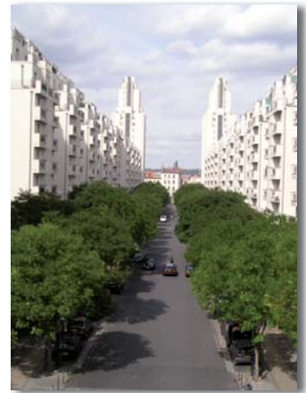
Villeurbanne - Av. H. Barbusse

Les contraintes aériennes importantes, telles que la proximité de bâtiments, câbles électriques ou de transports en commun, doivent impérativement être intégrées à leur localisation et au choix des essences.