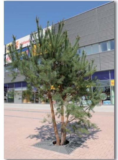
Vaulx en Velin - Carré de Soie

La proximité des réseaux souterrains et leur cohabitation doivent être étudiées le plus en amont possible du projet en associant les concessionnaires concernés et en effectuant si nécessaire des sondages. On appliquera le protocole de cohabitation des arbres et des réseaux en cas d'interférences.