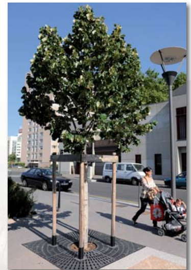
Lyon 7ème - Place des Drs Mérieux

Oui pour le remplacement et l'entretien.