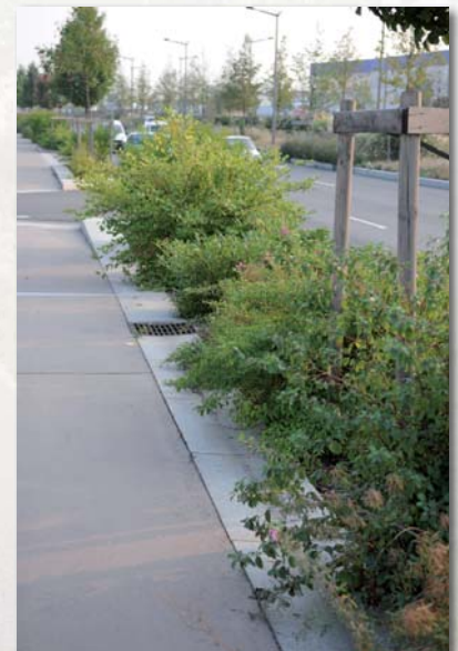
Lyon 7ème - Bd Ch. de la Bruyère

Non, entretien par les services des Espaces Verts des villes.