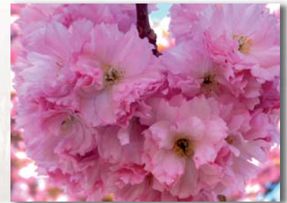
Cerisier à fleurs

La floraison et la fructification participent au maintien de la faune en ville (pollinisation, nourriture des oiseaux...).