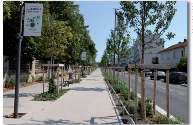
Vaulx en Velin - Rue de la Poudrette

La proximité des réseaux souterrains et leur cohabitation avec les arbres doivent être étudiées le