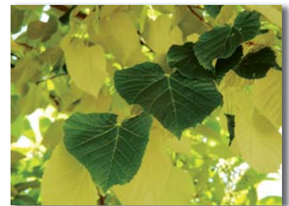
Feuille de Tilleul

Selon les espèces, le feuillage est plus ou moins dense (le marronnier a une ombre très dense et très sombre contrairement au bouleau qui a une ombre moins dense et plus lumineuse). Le choix de l'essence, et donc de son ombrage contribue à créer des ambiances différentes sur les lieux, et a une incidence sur les usages pratiqués. La densité de l'ombrage a également un impact sur la végétation positionnée en pied.